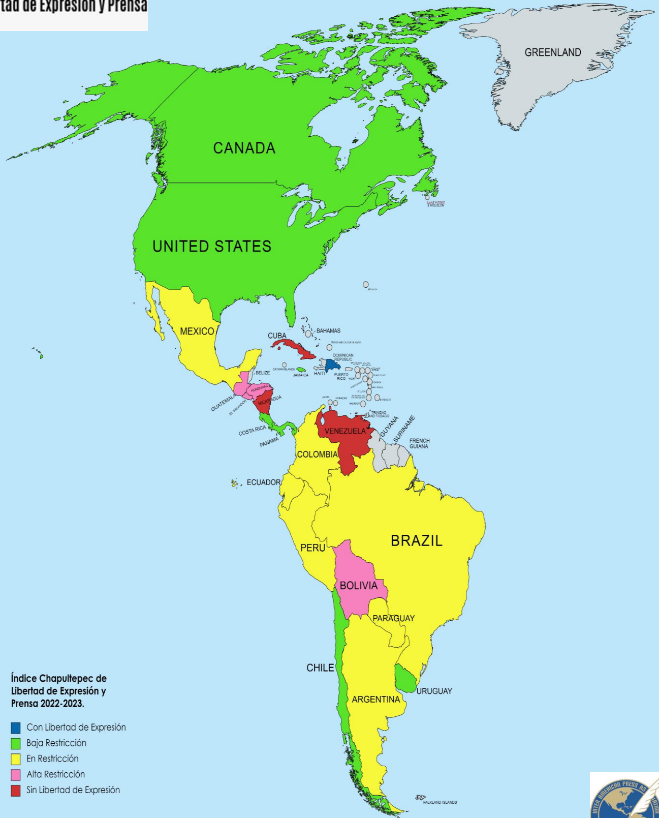
Índice Chapultepec de Libertad de Expresión y Prensa 2022-2023.