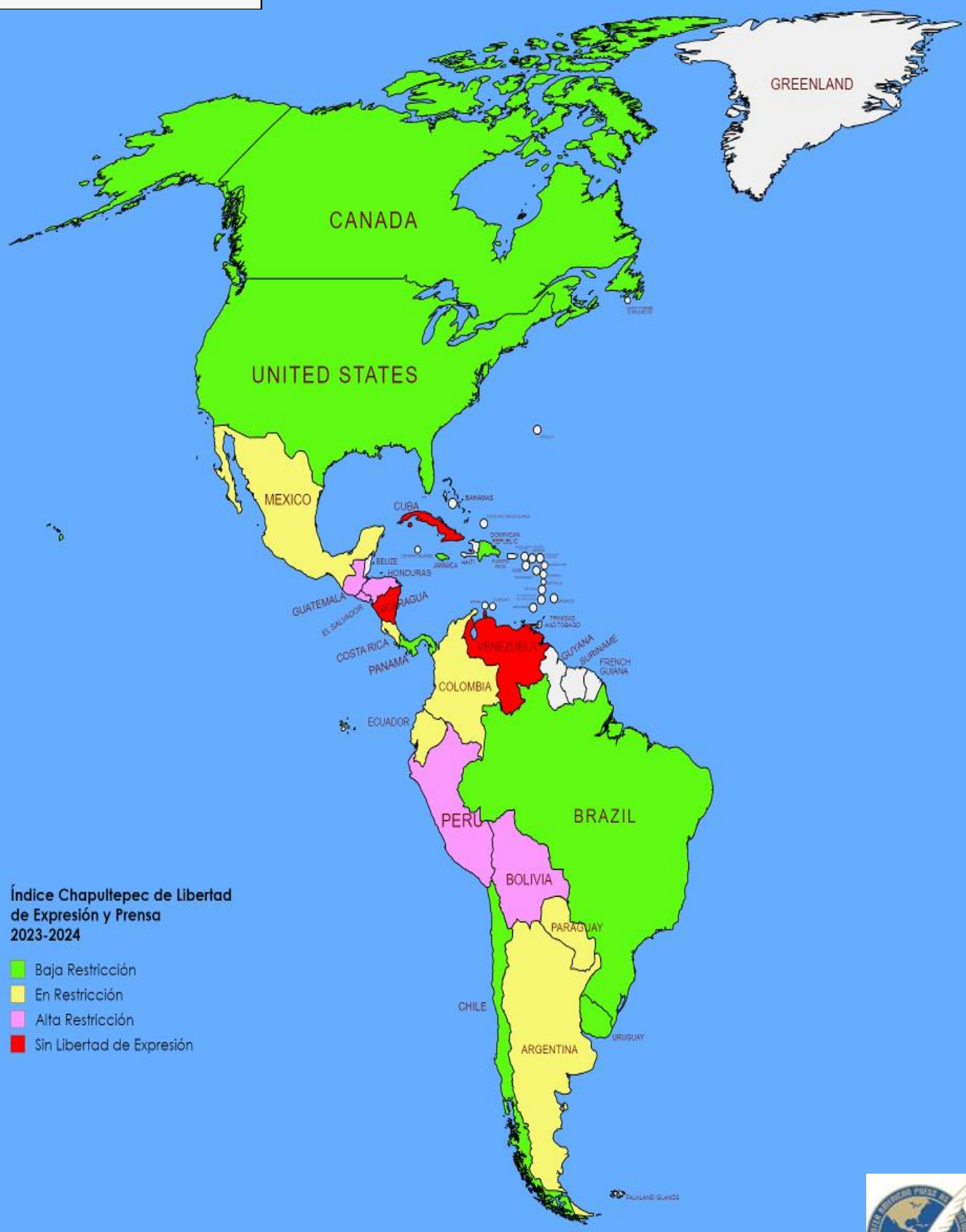
Índice Chapultepec de Libertad de Expresión y Prensa 2023-2024